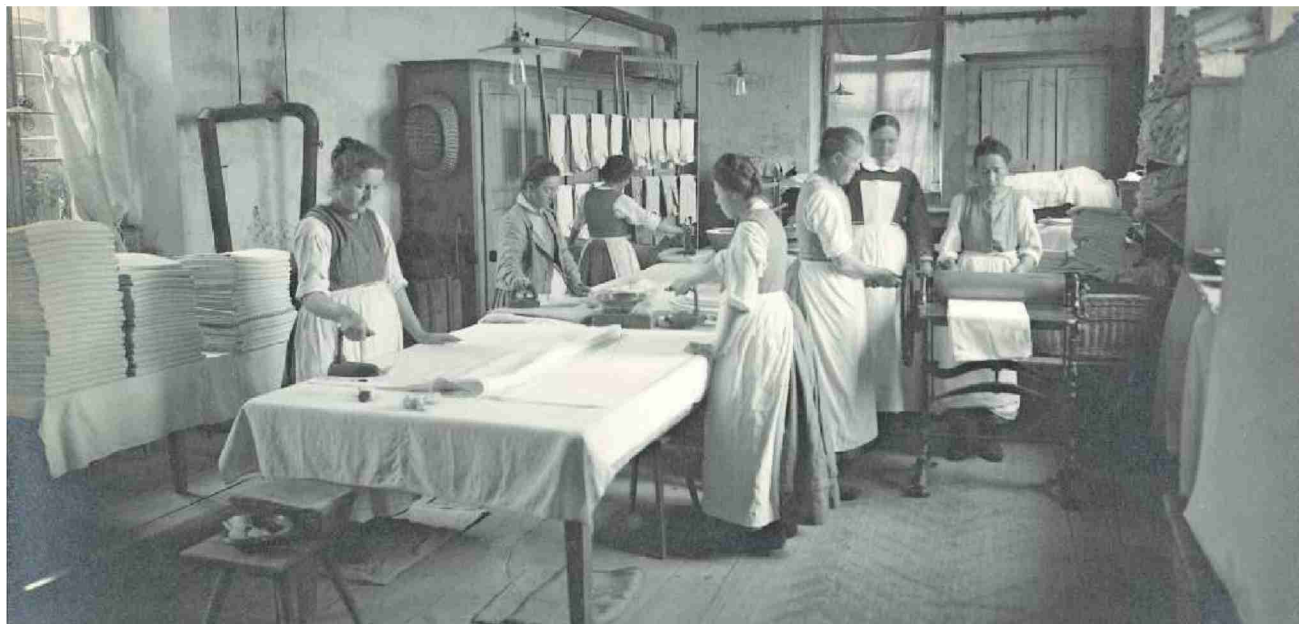
Ende der 1920er-Jahre waren bis zu 140 Frauen in Hindelbank untergebracht. Etwa zwei Drittel von ihnen waren damals administrativ Versorgte und mussten Zwangsarbeit wie etwa in der Glättereileisten.

In Hindelbank steht das einzige Frauengefängnis der Deutschschweiz. Und dies seit 125 Jahren. Einige Insassinnen schrieben unfreiwillig Geschichte: Als administrativ Versorgte oder als RAF-Terroristin.