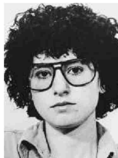
Gabriele Kröcher, RAF-Terroristin.

..... «Hindelbank. Das Schloss. Die Anstalt. Das Dorf – 1721 bis heute.», 304 Seiten, Sinwel Verlag, 48 Fr. Vom 16. Oktober bis 27. November findet in der Justizvollzugsanstalt Hindelbank zudem eine Ausstellung statt. Informationen gibt es unter: www.ausstellunghindelbank.ch